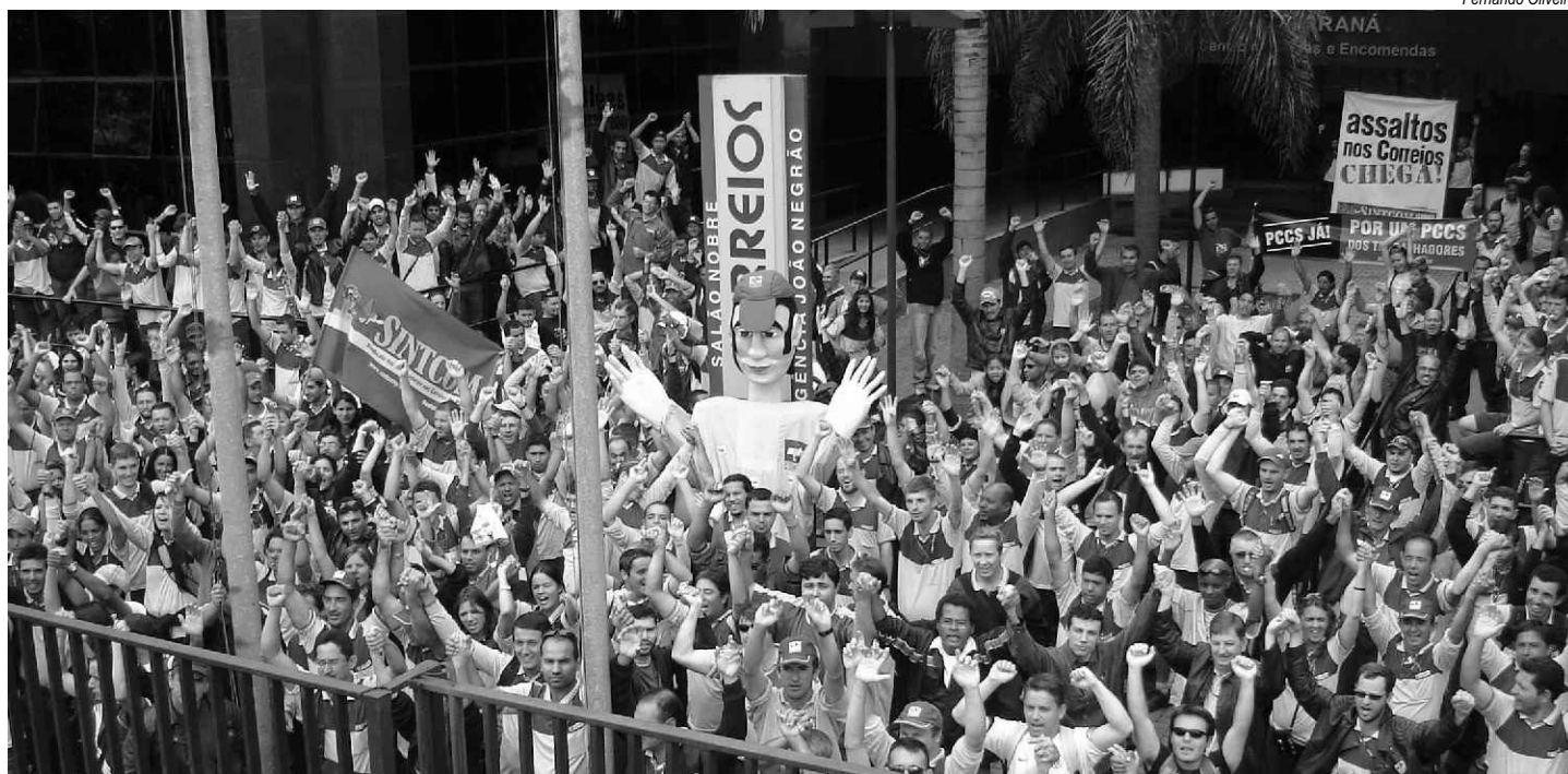
Trabalhadores dos Correios, em greve, reunidos diante do edifício-sede da empresa no Paraná: paralisação colocou a cúpula da ECT contra a parede